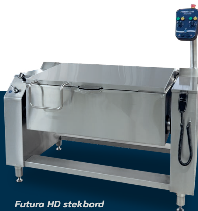
Futura HD stekbord