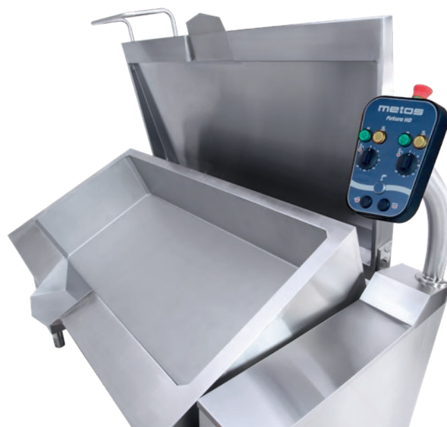
Futura HD 200L

Rostfritt stål, enhetliga ytor och panndelens rundade hörn gör rengöringen enkel. Metos Futura HD kan utrustas med vattenkran och handdusch som tillval. Futura HD 100 är dimensionerad för två GN1/1 kärl, HD 150 för tre GN1/1 kärl och HD 200 för fyra GN1/1 kärl. Panndelens djup är 273 mm.